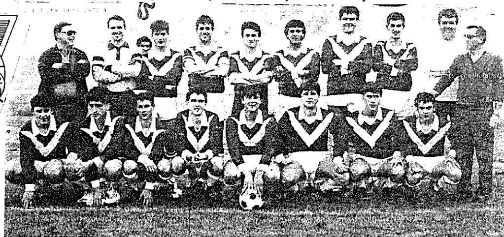
PLANTILLA DEL ASCENS TEMP. 1.987-1.988